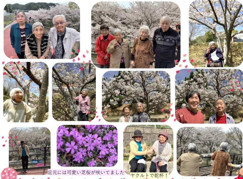
足元には可愛い芝桜が咲いてました

桜も満開となり久しぶりの外出です。お花見に東浜公園・海軍墓地・猫山ダムへ行ってきました。春はなんだか心ワクワクしますね。