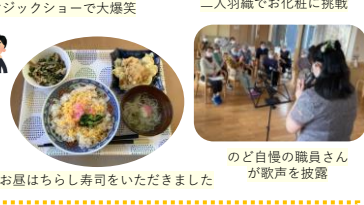
お昼はちらし寿司をいただきました