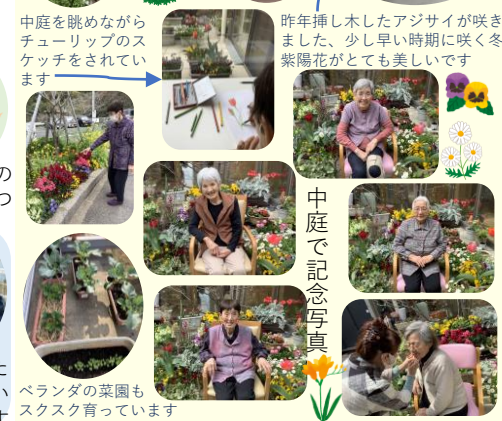
ベランダの菜園もスクスク育っています